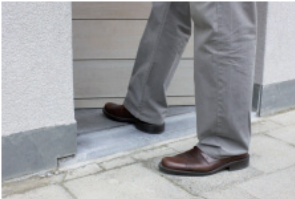
Vermijd drempels en onnodige niveaoverschillen

vlot toegankelijk is. Met bijvoorbeeld een verzonken schuifraam, kan de overgang van binnen naar buiten nagenoeg zonder niveaoverschil. Grote niveaoverschillen overbrug je waar mogelijk beter met een helling dan met een trede.