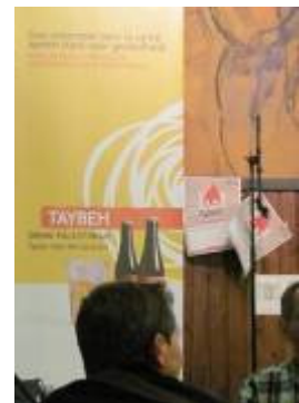
Foto rechts: een banner voor Taybeh-bier op het podium van het Lindenhof. Het is gebrouwen naar een recept uit Taybeh, een christelijk dorpje bij Ramallah op de Westelijke Jordaanoever. Het werd verkocht tijdens de 11.11.11-quiz en tijdens het Wereldfeest van de GROS om aandacht te vragen voor de positie van de inwoners van de Palestijnse staat wier economische en sociale vrijheden en mensenrechten worden beknod door een bezettingsleger uit buurland Israel.

Foto boven: actieve vrijwilligers achter de bar in jeugdhuis Phobos tijdens het 11.11.11-dansfeest.