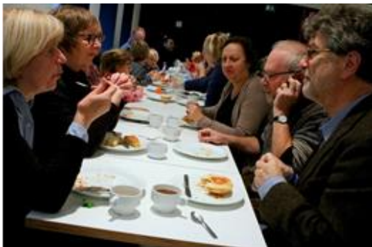
GROS-info die toen is verstrekt: